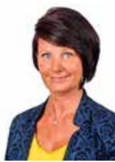
Sirli Tallo Transpordiamet, ennetustöö osakond

Sügisel ja talvel, mil pimedat aega pikalt, on autojuhtidel jalakäijaid ja jalgrattureid raskem märgata. Helkur ja helkivad tooted aitavad Sul end autojuhtide jaoks nähtavaks muuta!