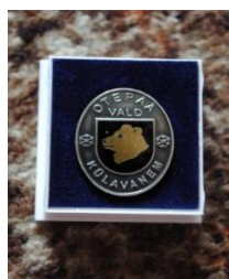
Otepää vald 2