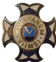
Viimsi vald 4