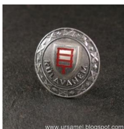
Kuusalu vald 1