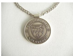
Avinurme vald 3